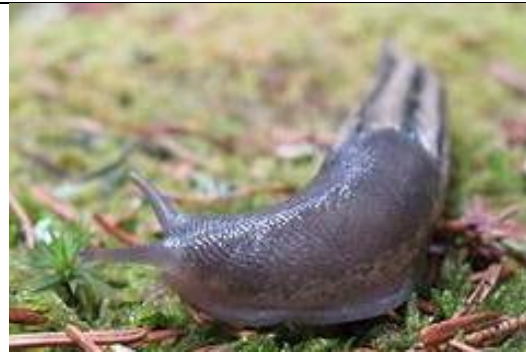
चित्र-ख: चिप्ले कीरा

व्यवस्थापनका बिधिहरू: यिनीहरूको संख्या कम पार्नको लागि शंखे/चिप्ली कीरा हिड्ने बाटो र बिरुवा/बारीको वरपर नुनको धुलो, सुख्खा काठको धुलो, अन्डाको बोक्राको टुक्रा साथै मानिस अथवा जनावरको रौं छर्नुहोस्। यिनीहरू लुकेर बस्ने ठाउँहरू जस्तै: झारपात, पात-पतिङ्गर, काठ तथा फोहर थुपारेको ठाउँलाई सफा राख्नुहोस्। शंखेकीरालाई जुनकिरी (Fire fly) र लाईटनिंग खपटे कीरा (Lightening beetle) को लार्भाले (चित्र-ग) खाने भएकोले यिनीहरूको सम्बर्धन गर्नुहोस्। १ के.जी. गहुँको चोकर, ३० ग्राम नीलोतुथो वा मेटलडिहाईड (Metaldehyde 5%), ५० ग्राम चिनी वा मोलासिस चाहिँदो पानीमा मिसाएर बनाईएको विषादी पासो डल्लो पारेर साँझपख बिरुवाको वरपर राख्नुहोस्। साथै प्रकोप ज्यादा भएमा मेटलडिहाईड (Metaldehyde 5%) का टुक्राहरू ५० के.जी. प्रति हेक्टरको दरले वा ५० ग्राम नीलोतुथो १ लिटर पानीमा मिसाएर बिरुवा/बारीको वरपर साँझपख छर्नुहोस्।