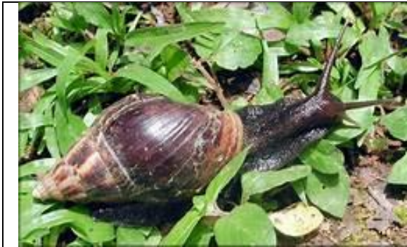
चित्र-क: शंखे कीरा