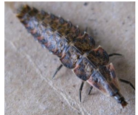
चित्र-ग: जुनकिरीको लार्भा

व्यवस्थापनका बिधिहरू: यिनीहरूको संख्या कम पार्नको लागि शंखे/चिप्ली कीरा हिड्ने बाटो र बिरुवा/बारीको वरपर नुनको धुलो, सुख्खा काठको धुलो, अन्डाको बोक्राको टुक्रा साथै मानिस अथवा जनावरको रौं छर्नुहोस्। यिनीहरू लुकेर बस्ने ठाउँहरू जस्तै: झारपात, पात-पतिङ्गर, काठ तथा फोहर थुपारेको ठाउँलाई सफा राख्नुहोस्। शंखेकीरालाई जुनकिरी (Fire fly) र लाईटनिंग खपटे कीरा (Lightening beetle) को लार्भाले (चित्र-ग) खाने भएकोले यिनीहरूको सम्बर्धन गर्नुहोस्। १ के.जी. गहुँको चोकर, ३० ग्राम नीलोतुथो वा मेटलडिहाईड (Metaldehyde 5%), ५० ग्राम चिनी वा मोलासिस चाहिँदो पानीमा मिसाएर बनाईएको विषादी पासो डल्लो पारेर साँझपख बिरुवाको वरपर राख्नुहोस्। साथै प्रकोप ज्यादा भएमा मेटलडिहाईड (Metaldehyde 5%) का टुक्राहरू ५० के.जी. प्रति हेक्टरको दरले वा ५० ग्राम नीलोतुथो १ लिटर पानीमा मिसाएर बिरुवा/बारीको वरपर साँझपख छर्नुहोस्।