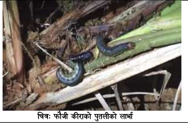
चित्र: फौजी कीराको पुतलीको लार्भा