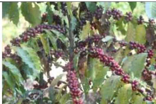
चित्र: राम्ररी पाकेका कफीका चेरी