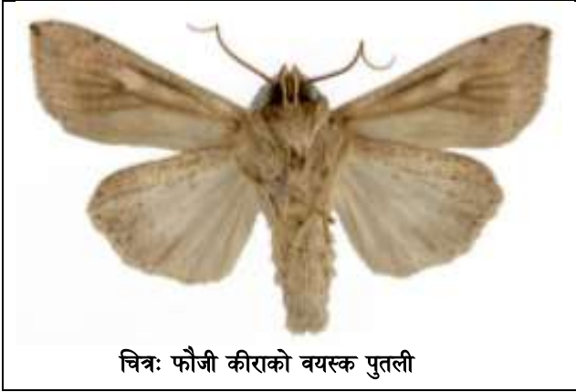
चित्र: फौजी कीराको वयस्क पुतली