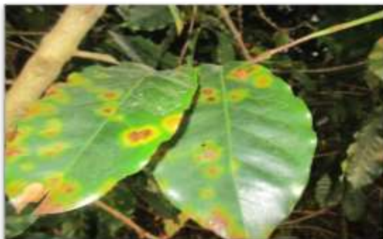
चित्र: पातको माथिल्लो भागमा देखिएको सिन्दुरे रोगको लक्षण