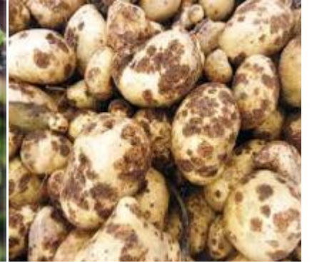
३. आलु स्केव