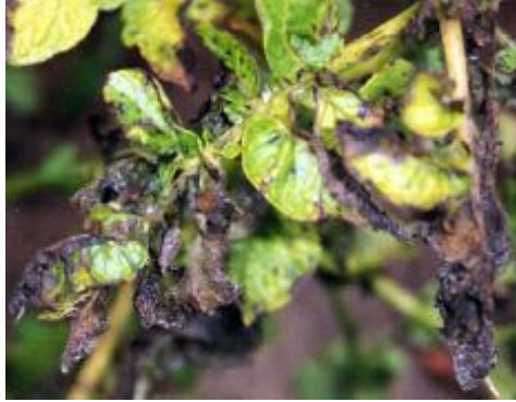
२. पछौटे डडुवा