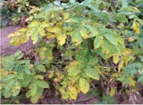
१. अगौटे डडुवा रोग