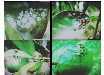
चित्र: सुन्तलाजात फलफूलको फल झार्ने हरियो पतेरोको विभिन्न अवस्थाहरू