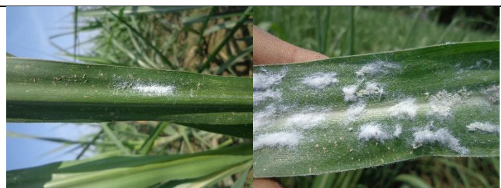
पातमा लागेको फड्के कीरा