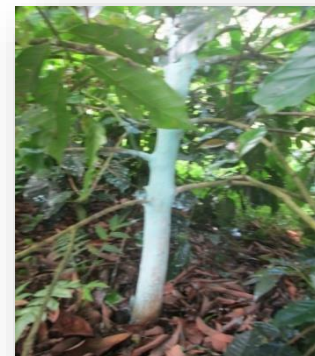
चित्र: कफीको मुख्य काण्डमा १०% को बोर्डो मिश्रणको लेप लगाईएको