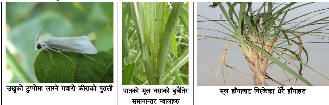
उखुको टुप्पोमा लाग्ने गवारो कीराको पुतली