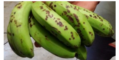
चित्र: केरामा कोत्रे कीराको क्षति