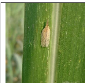
फड्के कीराको बयस्क