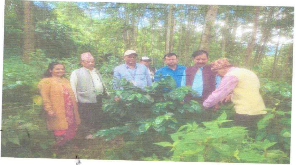
जिसस प्रमुखज्यू सप्रजिअज्यू जान केन्द्रका प्रमुखज्यू लगायतको टोलीलाइ कफि खेतीको वारेमा जानकारी गराउदै सम्बन्धित किसान