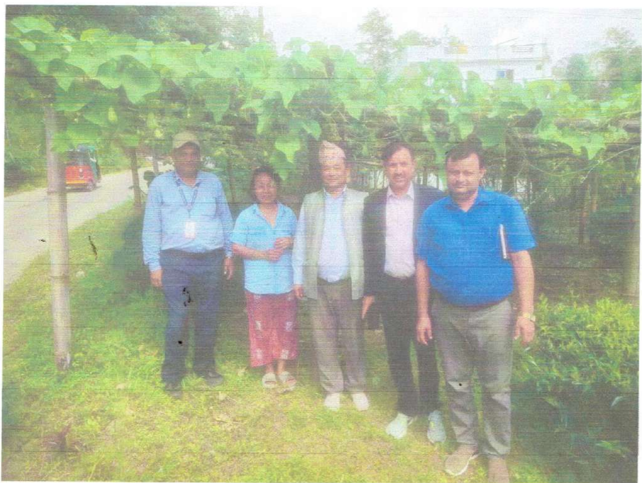
अनुगमनका क्रममा लिइएको तस्विर