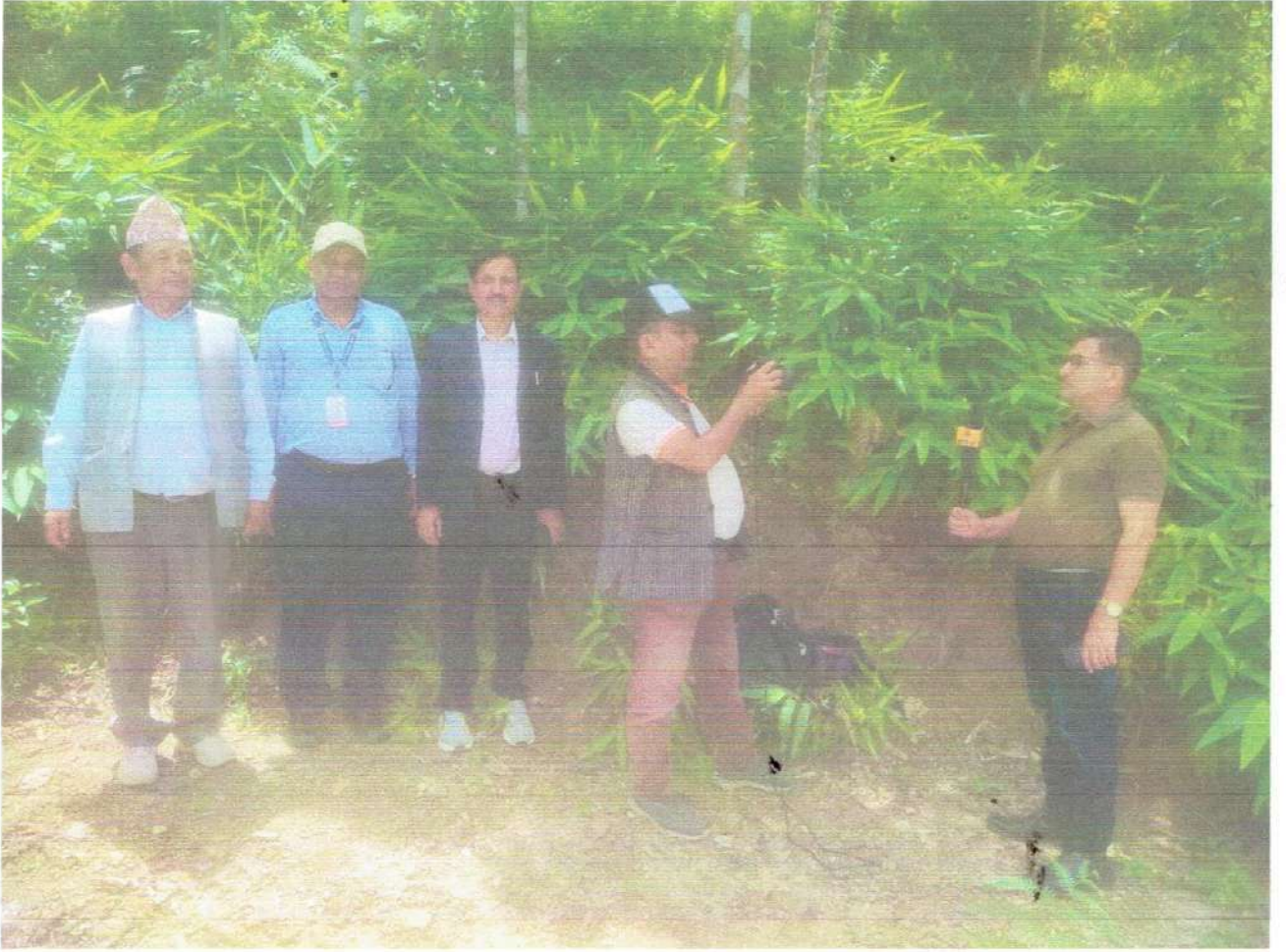
फलफुल बगैँचाको अवलोकनका क्रममा जिसस प्रमुख सप्रजिअ ज्ञान केन्द्रका कार्यालय प्रमुख