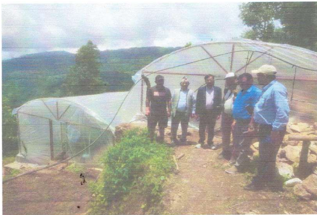
खरेल कृषि फर्ममा अनुगमनको दृष्य