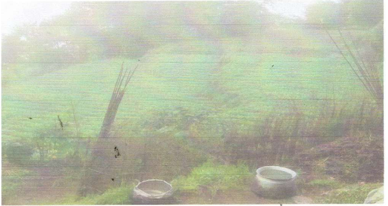
आलु खेती पश्चात लगाइएको मुला खेतीको दृष्य