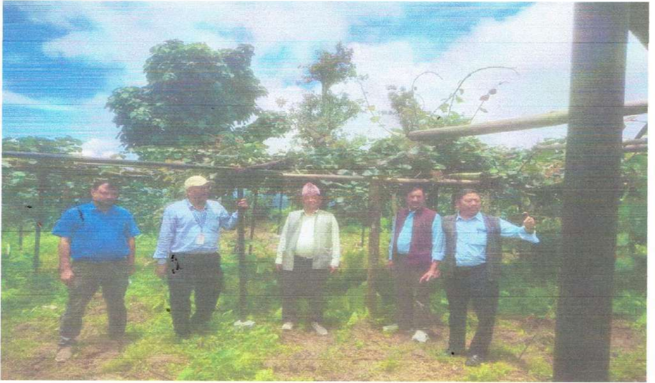
किवी खेतीको अनुगमनको दृष्य