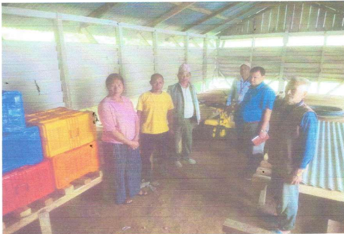
मर्मत गरिएको भण्डारण गोदामको अवलोकन गरिदै