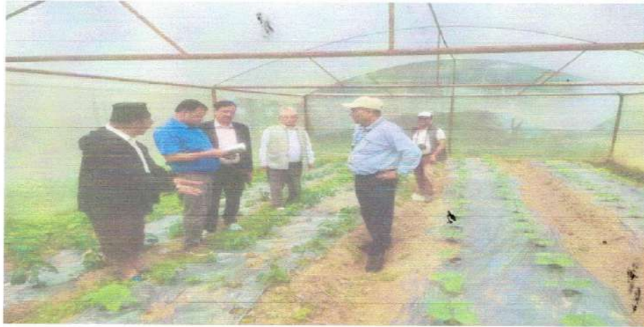
टनेलमा लगाइएका तरकारीका विरुवा अवलोकन गर्दै जिसस प्रमुखज्यू सप्रजिअज्यु